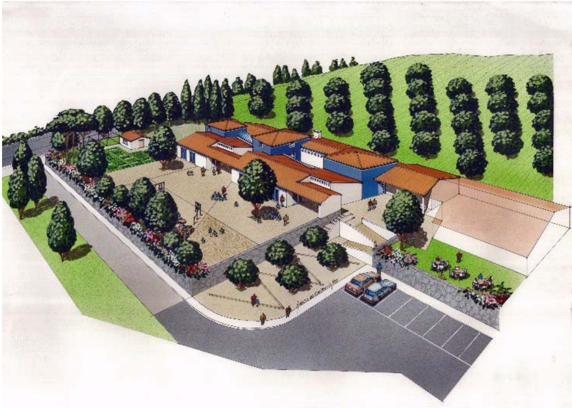
1º Lugar para o projecto de um Jardim de Infância em Odemira (Projecto não construído, Dez 1992).